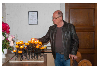
Stadtteilführung Widerstand und seine Folgen