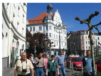
Stadtteilführung Stern des Nordens