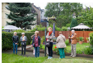
Stadtteilführung Nordmarkt Geschichten