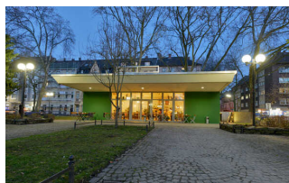
Nordmarkt – "Grüner Salon"