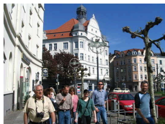
Stadtteilführung Stern des Nordens