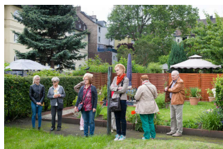
Stadtteilführung Nordmarkt Geschichten