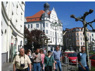
Rundgang: Stern des Nordens