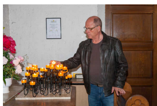
Stadtteilführung Widerstand und seine Folgen