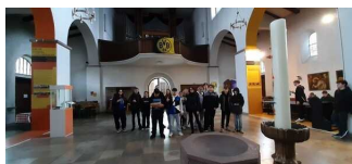
Rundgänge – Dreifaltigkeitskirche