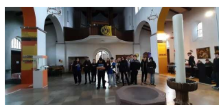
Rundgang "Widerstand und seine Folgen"