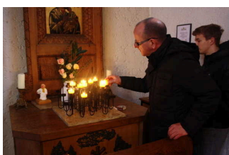
Rundgang "Widerstand und seine Folgen"